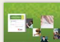
Haciendo Escuela Falabella