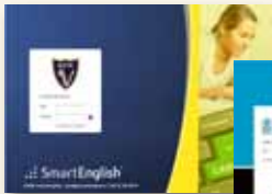
Colegio Sagrado Corazón Monjas Inglesas