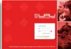
Pregrado U. Adolfo Ibáñez