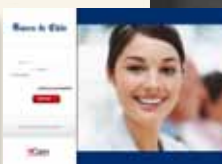
Banco de Chile